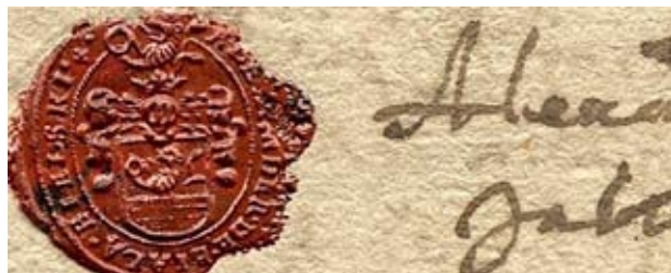
II. 3. Pieczęć lakowa na piśmie z 8 czerwca 1652 roku, herb Bielskich Prawdzic – głowa lwa wychylająca się z muru obronnego

Warto wspomnieć, że znana jest treść testamentu Marianny Bielskiej z 1665 roku. Ponieważ Ruda podlegała zarządowi dóbr biskupów wrocław-